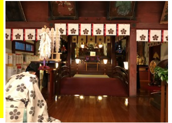
KEC正月特訓2022年元日 金沢神社にて

◆講習費 14,000円(教材費・消費税込) 1日または2日のみ受講も可能です(1日受講費:7000円)